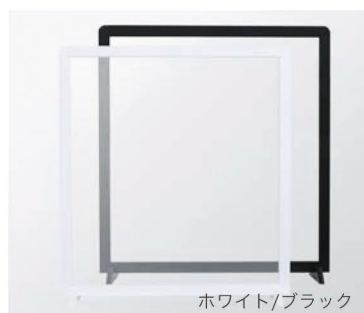
ホワイト/ブラック

フレームもアルコール除菌が可能です。不安定な場所に置くと落下してケガをする可能性があります。表面の印字をした場合は、アルコール除菌はお控えください。写真は試作品です。予告なく仕様が変更になる場合があります。